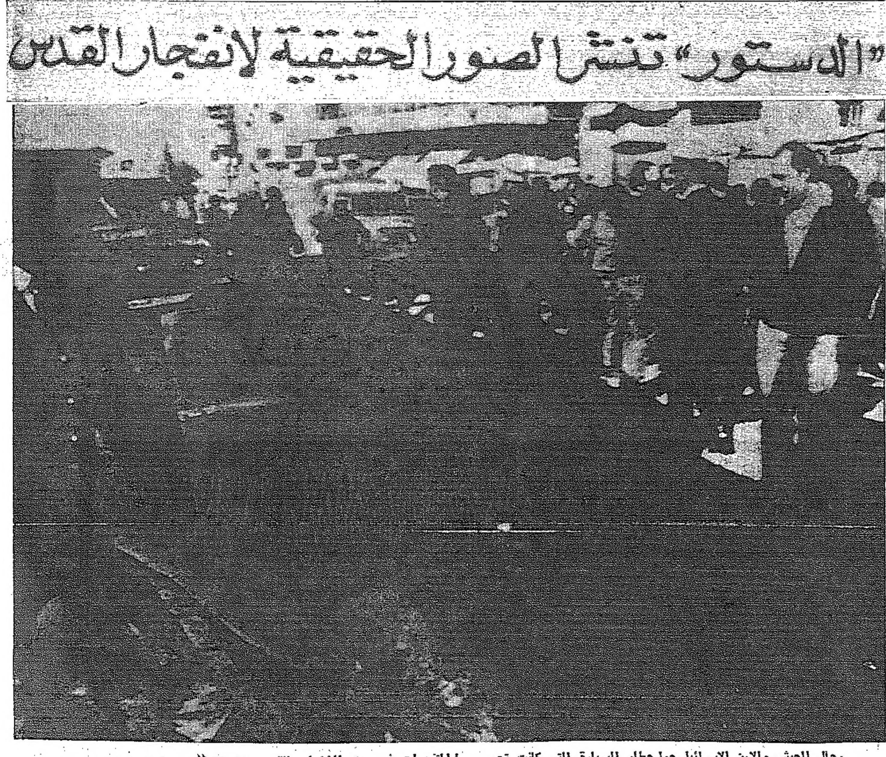
رجال الجيش والامن الاسرائيلي حول سيارة التي كانت تحمل المتفجرات في سوق الخضار بالقدس المحتلة

سلطات الاحتلال تفتشها بيابياً وغرفة غرفة وتعتقل المئات من أبناءها السيارة المتفجرة من نوع موريس موديل ٥٣/٤٨ - السكّات الفزل صدروا هجوماً مهورياً لسيما